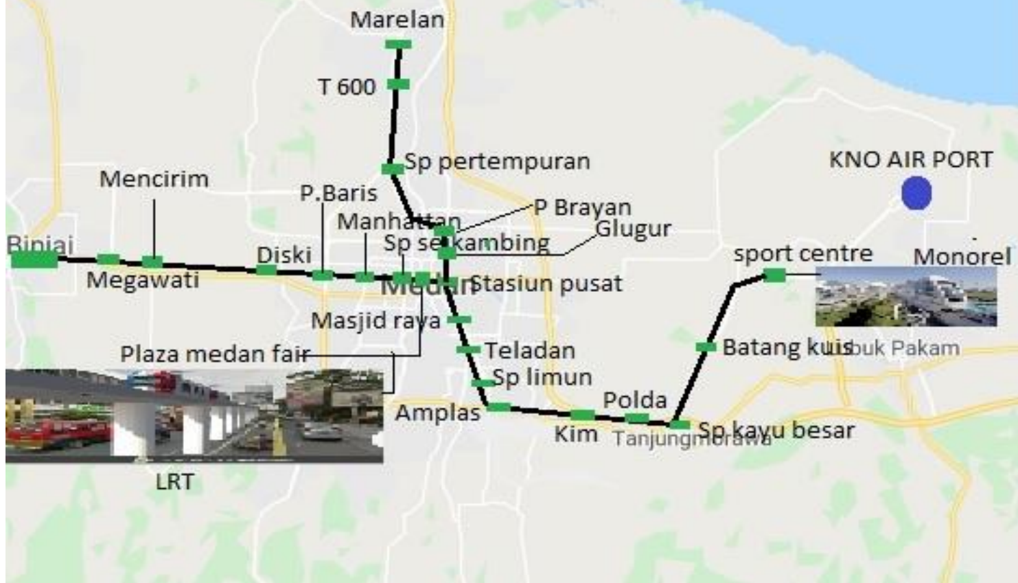
RUTE MONOREL SPORT CENTER